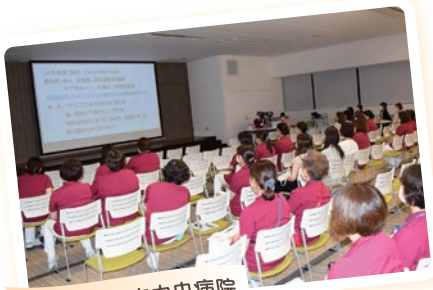
9/11 石川県立中央病院