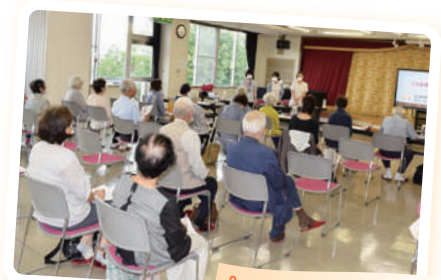
9/28 金沢市城南公民館

からお亡くなりになるまでの経緯などの情報を伝えた後、参加した看護職は「利用者(患者)の意思確認は十分に行われていたか」「医学・看護の判断は本人に伝わっていたか」「家族(周囲)の意向を把握できていたか」の「ACPの3本柱」について話し合い、意見交換をしました。